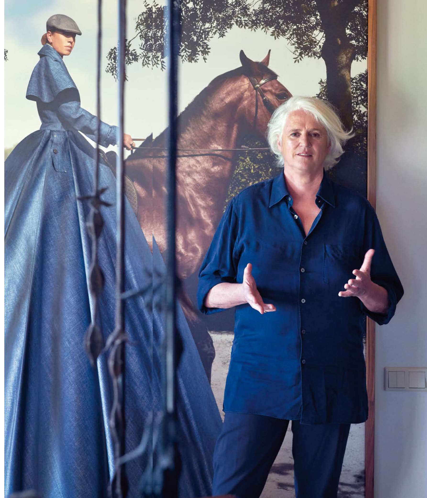
Links: Van 't Veer thuis voor 'Horse and Rider', 2012, van Freudenthal/Verhagen. Hieronder: 'Randy #027857', 2017, van Robin de Puy, bij The Ravenstijn Gallery.